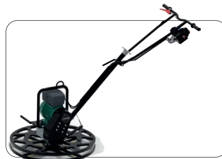
LTM750ER elektriske glattemaskiner