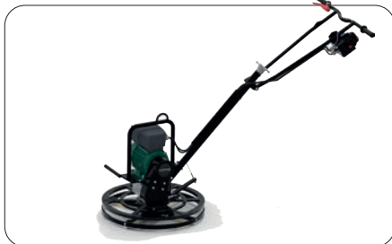
LTM600ER elektriske glattemaskiner