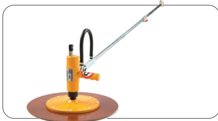
LAP pussemaskiner for elementproduksjon

Vi leverer både elektriske og pneumatiske pussemaskiner for elementproduksjon. I tillegg har vi glattemaskiner i forskjellige størrelser. Leveres med Honda motor eller som elektriske maskiner.