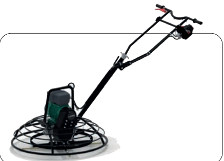
LTM900ER elektrisk glattemaskin