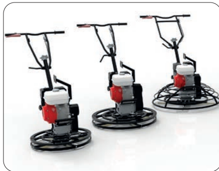
LTM bensindrevne glattemaskiner